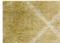
タバコを吸わない事務所