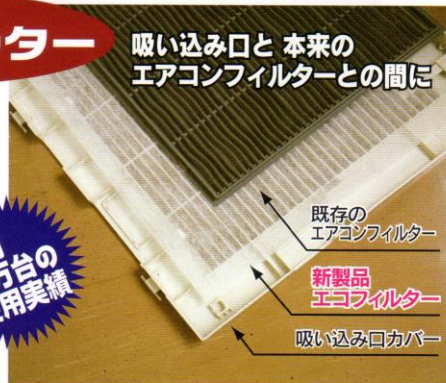
既存の エアコンフィルター 新製品 エコフィルター 吸い込み口カバー